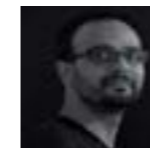
Marc Binefa DOS PUNTS ARQUITECTURA www.dospuntsarquitectura.com