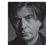
Carlos Ferrater OAB ARQUITECTOS www.ferrater.com