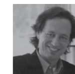
Fermín Vázquez B720 ARQUITECTOS www.b720.com