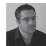
Jose Miguel Roldán ROLDÁN Y BERENQUER ARQUITECTES www.roldanberengue.com