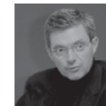
Ramón Sanabria RAMÓN SANABRIA ARQUITECTOS ASOCIADOS www.ramonsanabria.com