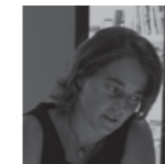
Barbara Balanzó BB ARQUITECTES www.bbarquitectes.com