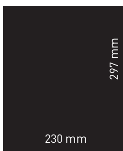
Página color Precio: 2.300 €