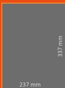
Página completa Precio: 2.350 €